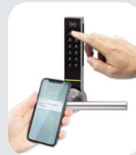
Code PIN pour l'entrée et la porte de chambre